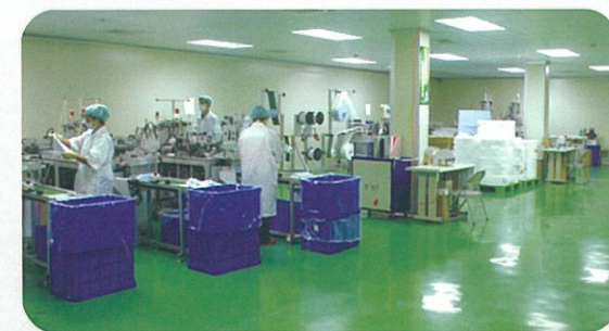
台灣醫療優良製造規範 (GMP)