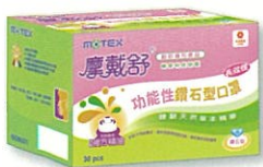
香菊花樣鑽石型口罩